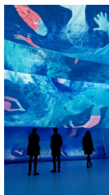
Rosée bleue, Charlotte Denamure, Biennale Lyon, 2019