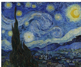
Nuit étoilée, Van Gogh