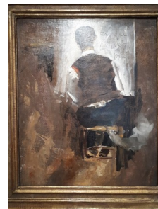
Le pet, Toulouse Lautrec, Abbaye de Fontevraud