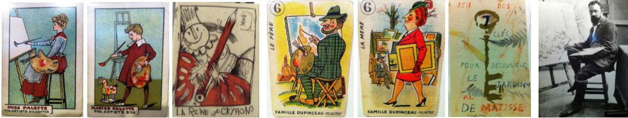
Photos prises dans le musée de la carte à jouer Issy Les Moulineaux

Lieux traversés : Parc André Citroën, Aquaboulevard, Parc Suzanne Lenglen, Musée de la carte à jouer (Issy les Moulineaux)