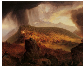
The four elements, Cole Thomas

« Un jardin est le résultat d'un arrangement de matériaux naturels selon des lois de esthétiques, entremêlées au regard que porte l'artiste sur la vie », Burle Marx, l'œil, mai 2011