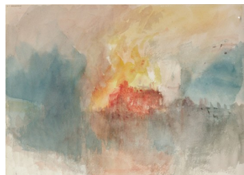
Feu tour de Londres, aquarelle Turner

Il suffira d'une étincelle D'un rien, d'un geste Il suffira d'une étincelle D'un mot d'amour pour Allumer le feu Allumer le feu Allumer le feu Et faire danser les diables et les dieux Allumer le feu Allumer le feu Et voir grandir la flamme dans vos yeux Oh, allumer le feu Allumer le feu Et faire danser, les diables et les dieux Allumer le feu (allumer le feu) Allumer le feu (allumer le feu)