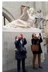
A la galerie David d'Angers