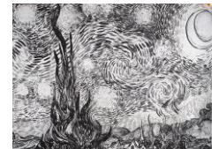
En noir et blanc