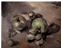
Les pommes vertes, Cézanne