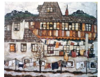
Maisons et linge qui sèche, Schiele