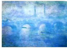
Le pont de Waterloo dans le brouillard, Monet