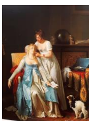
La Mauvaise Nouvelle, Marguerite Gérard