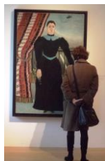
Au musée Picasso