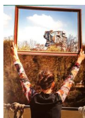
D'après une photo Gutierrez-Ortega