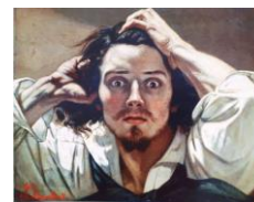
Le désespéré, Gustave Courbet « Désespéré d'avoir perdu mon numéro »