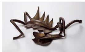
Femme égorgée, Giacometti