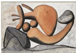
Femme lançant une pierre, Picasso

De plus en plus d'expositions mettent en parallèle deux artistes. Faire ses propres rapprochements sans hésiter à aller jusqu'au conflit.