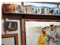
Salon aquarelle, Clermont-Ferrand