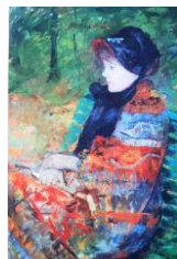
Portrait de profil de Lydia Cassatt, Mary Cassatt