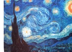
La nuit étoilée, Van Gogh