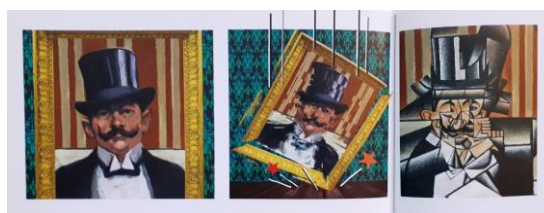
Homme dans un café (détail), Juan Gris