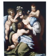
« Il faut vraiment que je trouve une nounou »