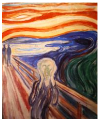
Le Cri, Munch

9. Le musée du détail : Se focaliser sur un détail, l'agrandir. En faire un tableau abstrait. Ex. : Le cri de Munch. Ou au contraire dézoomer et élargir le cadre du tableau. Qu'y-a-t-il autour ?