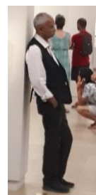
Lors de visites...

Un professeur d'histoire de l'art arrête tout, pour postuler un emploi de gardien au Musée d'Orsay à Paris.