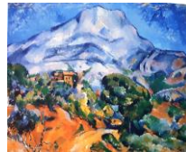
La montagne Sainte-Victoire, Cézanne