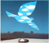
Le retour, René Magritte