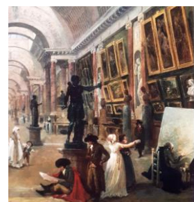
Grande galerie du Louvre, H. Robert