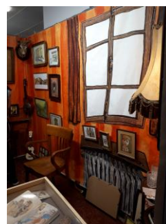
Salon aquarelle, Clermont