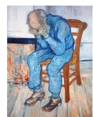
Vieil homme dans la douleur, Vincent Van Gogh