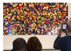
A la Fondation Vuitton