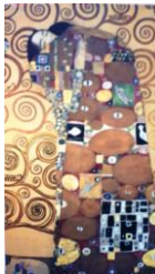
Frise Stoclet, Klimt