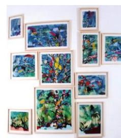
Galerie Dilecta, Art Paris 2019