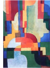
Formes colorées, August Macke

10. Le musée du cadre : Choisir un paysage et l'encadrer !