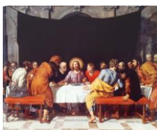
La Sainte Cène, Pourbus Le Jeune « Ils auraient quand même pu repasser la nappe »

Ou les propositions de F. Foresti et E. Vignot dans L'art d'en rire :